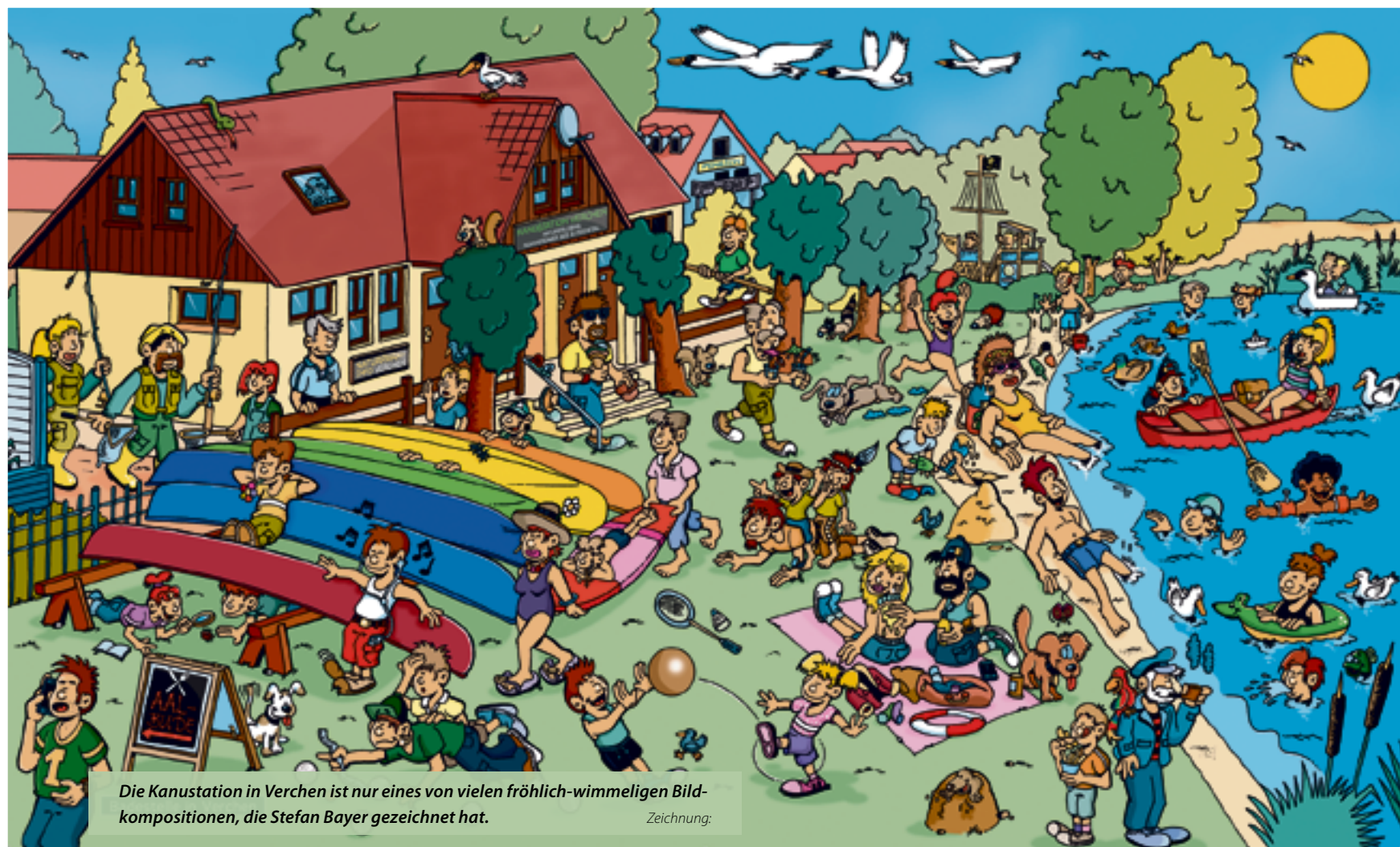
Die Kanustation in Verchen ist nur eines von vielen fröhlich-wimmelligen Bildkompositionen, die Stefan Bayer gezeichnet hat. Zeichnung:

Was tun, wenn der See ausgiebig bebadet, die umliegenden Tierparks besucht, jedes Fischbrötchen gegessen und alle Feldwege schon beradelt wurden? Vielen Touristen fällt es schwer, abseits der gewohnten Pfade Orte zu finden, die Groß und Klein gleichermaßen froh machen. Die Wimmelbücher von Stephanie Riesebeck und Hannah Kuke sind deshalb nicht nur ein beliebtes Mitbringsel aus der Region, sondern zeigen sie aus vielfach ungewohnten Blickwinkeln. Und das ist für Einheimische genauso toll.