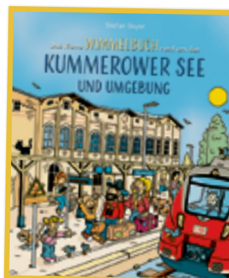
Das erste Wimmelbuch entsteht mitten im ersten Corona-Jahr, das zweite zu Weihnachten 2021.