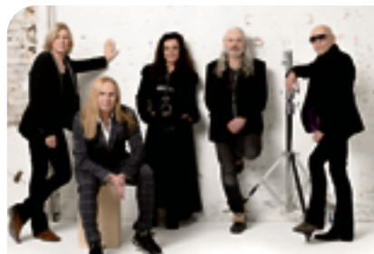
Silly geben in diesem Jahr 12 Open-Air-Konzerte – eines davon auf Rügen.

▲ Beim Zuparken-Festival stehen Newcomer genauso auf der Bühne wie gefeierte Acts der Indie- und Elektro-Szene.